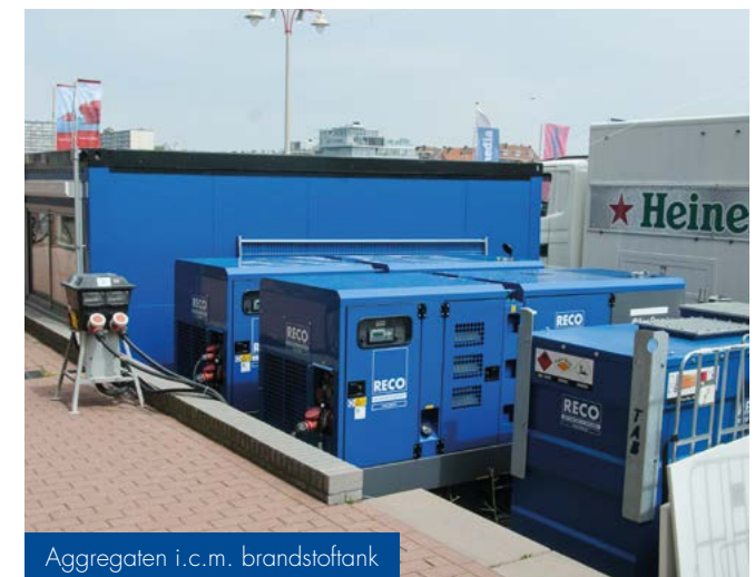
Aggregaten i.c.m. brandstoftank